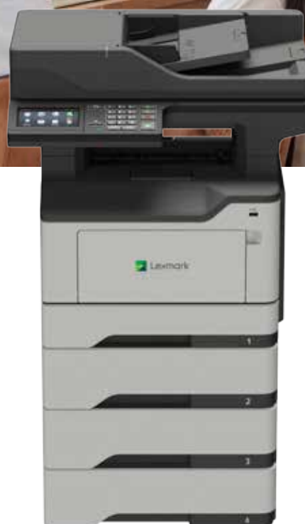
XM1246 met optionele laden

Betrouwbaarheid. Beveiliging. Productiviteit.