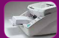
Laagste stand (500 vel)